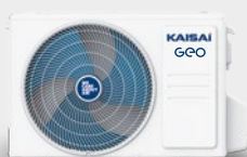
Kültéri egység KGE